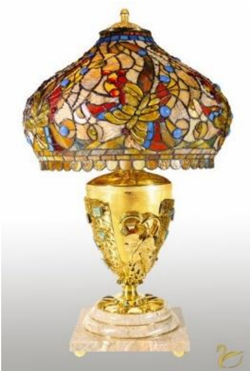
Lampa gabinetowa z abażurem ze szkła witrażowego z bursztynem